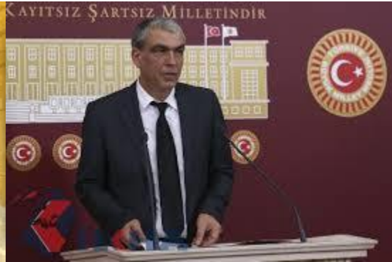
German Chancellor Angela Merkel met members of Turkey's Kurdish HDP party on Thursday during her visit to capital Ankara.