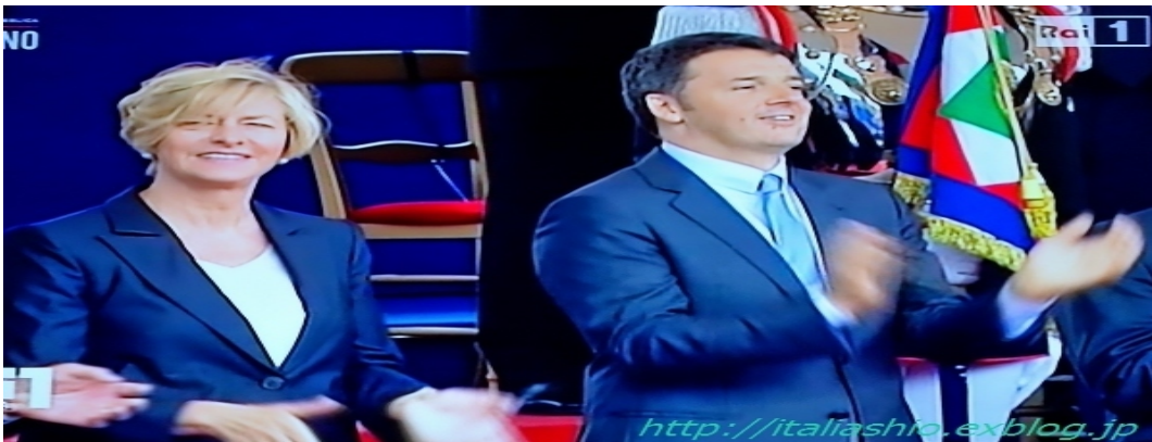
2016 年 6 月 4 日 - イタリアは第2次大戦後の国民投票により、それまでの王政から共和国となり、今年で 70 周年。その意味では、初 の女性防衛大臣、ロベルタ・ピノッティ・Roberta Pinotti、右：レンツィ首相