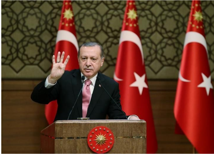
トルコのエル ドガン大統領

は、大統領権限憲法改正案を提出したことを明らかにした。副首相は 4 月 16 日に国民投票を実施する予定であるとした。