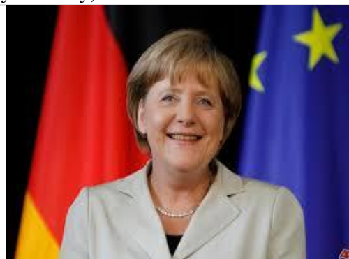
Angela Merkel ドイツ首相