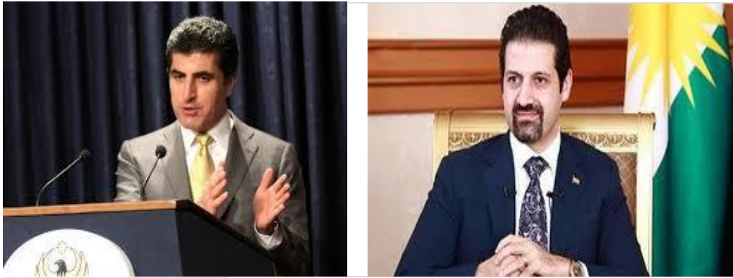
左：クルド自治政府首相 Nechirvan Barzani, 右クルド自治政府副首相 Qubad Talabani