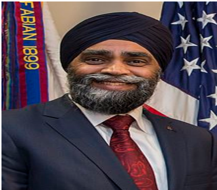
Minister of National Defence Harjit Sajjan since 4 November 2015

MOSCOW ,— Farhat Patiev, the head of the Council of the Federal National-Cultural Kurdish Autonomy in Russia stated that the leaders of Syrian Kurdistan as well as Kurds from other parts of historic Kurdistan will visit Moscow on February 15 for a conference on the Middle East