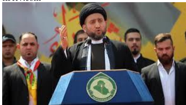
Alliance Ammar al-Hakim