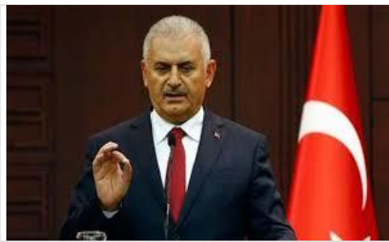
Binali Yildirim. トルコ首相