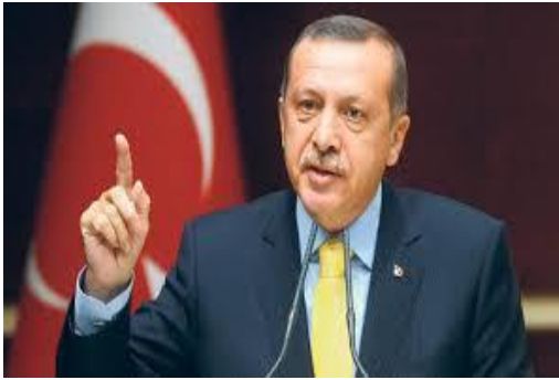
Tayyip Erdogan トルコ大統領